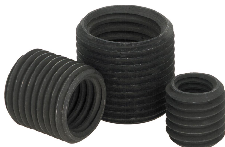
压配衬套和螺纹轴套的安装说明